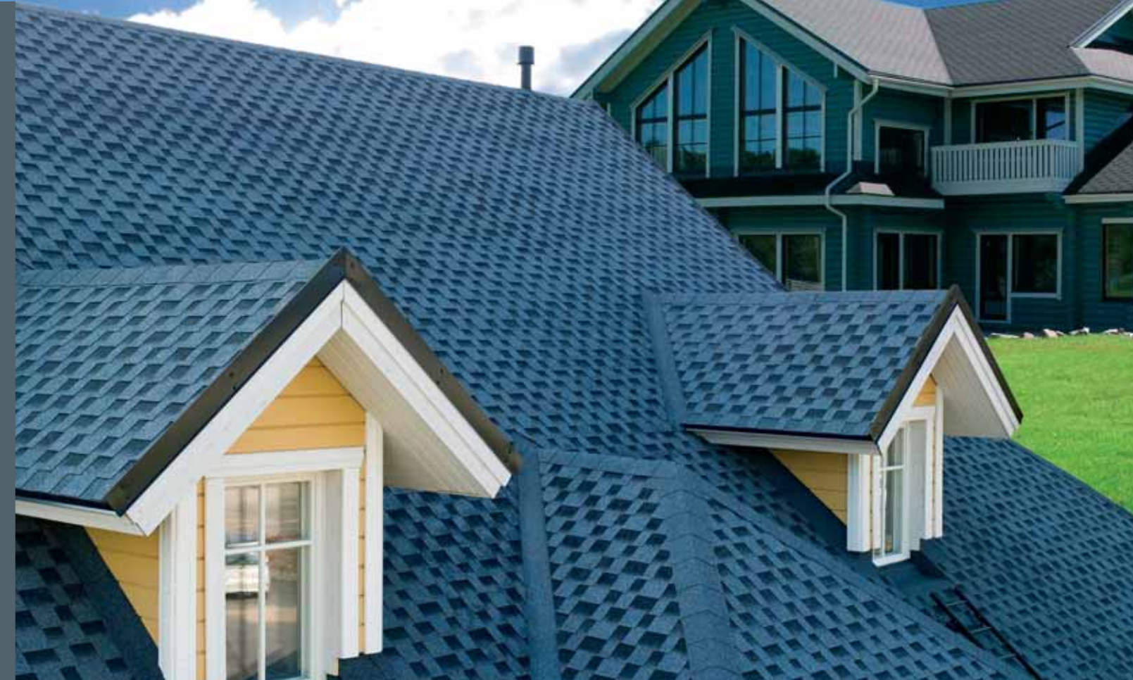
KERABIT S – vlňa